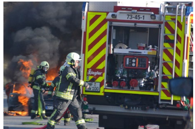
Unter schwerem Atemschutz wird dann gelöscht

Die zentrale Feuerwehr- und Rettungsleitstelle Nord in Harrislee löste sofort Alarm für die Feuerwehr Hattstedt-Wobbenbüll aus; diese rückte zügig mit dem ersten Tanklöschfahrzeug an. Atemschutzgeräteträger löschten mit Wasser aus dem großen Feuerwehr-Tankfahrzeug. Mehrere Streifenwagen sperrten die stark befahrene B 5 voll ab; ein Rettungswagen des Landkreises eilte aus nördlicher Richtung an die Einsatzstelle. Rasch hüllte dunkler Rausch die unmittelbare Umgebung ein. Die pechschwarze Rauchsäule war im Landkreis kilometerweit zu sehen.