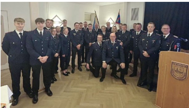
Alle Gewählten, Geehrten, Beförderten auf einem Foto

Bericht: Helmuth Möller - hem -