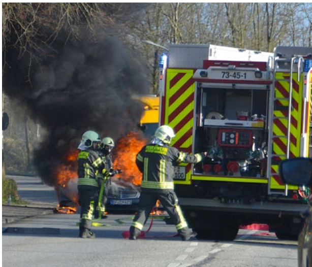
Wasser aus dem Tanker wird in die Schläuche gepumpt

Dramatische Bilder am Gründonnerstag (2.4.2026) auf der B5 in der Ortsdurchfahrt von Hattstedt: um kurz nach 18 Uhr ging dort im starken Oster-Reiseverkehr ein in Richtung Norden fahrender silberner PKW Mercedes mit Erfurter Kennzeichen in meterhohen Flammen auf. Das Feuer breitete sich rasant aus; immer wieder waren laute Knallgeräusche zu hören. Der Fahrzeugverkehr stockte abrupt, mehrere Autofahrer wählten den Notruf.