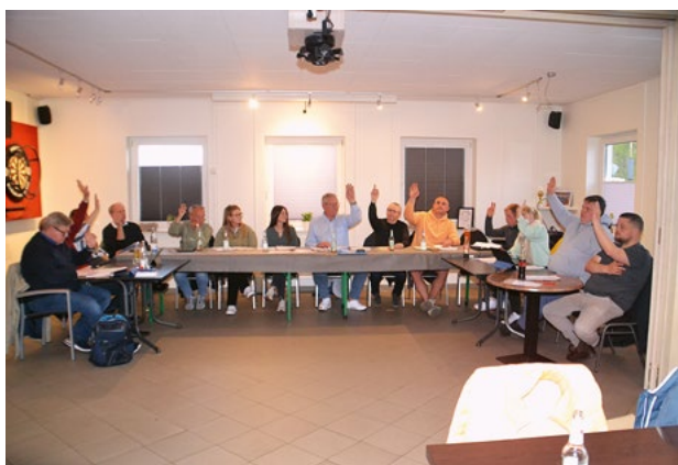
Abstimmung per Handzeichen im Gemeinderat

Bericht und Foto von Helmuth Möller - hem -