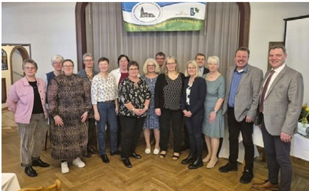
LandFrauen und die Bürgermeister von Hattstedt, Arlewatt, Horstedt, Olderup, Wobbenüll