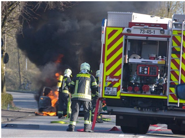
Das erste Tanklöschfahrzeug ist eingetroffen

Bericht und Fotos von Helmuth Möller - hem -