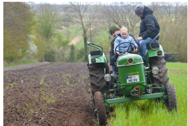
Auch die Kleinen dürfen - unter Aufsicht - mal steuern

wurde diese Veranstaltung nach alter Tradition mit einem gemeinsamen Essen am Feldrand.