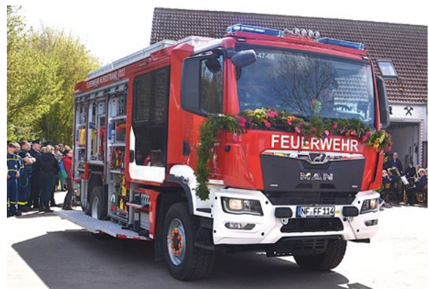
16 to schwer – und ab sofort einsatzbereit