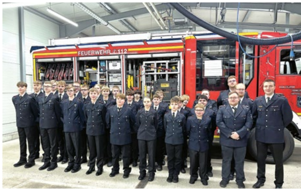
Antreten der Jugendfeuerwehr fürs Gruppenfoto

Bericht von Tjarde Arndt