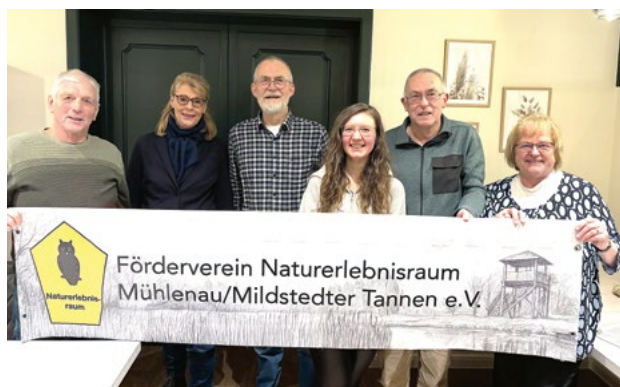
Der Vorstand nach der Wahl. Foto: NER

Bericht und ein Foto von Helmuth Möller - hem -