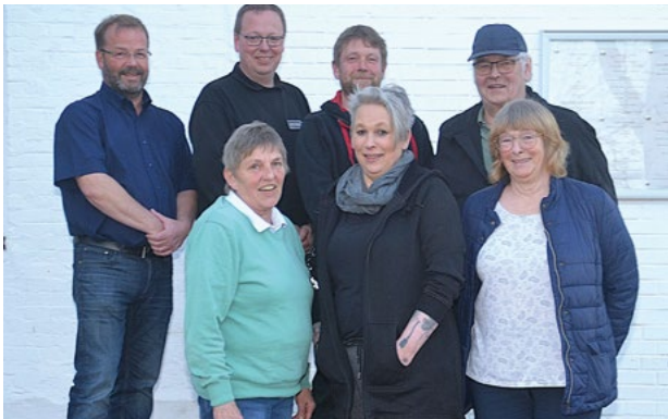
Bauernmarkt-Akteure des HGV Kirchspiel Schwabstedt

Bericht und Foto von Helmuth Möller - hem -