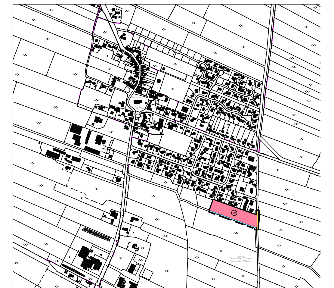
Übersichtsplan M 1 : 10.000

Gemeinde Witzwort, 31. Änderung des gemeinsamen Flächennutzungsplanes der Gemeinden Seeth, Drage, Koldenbüttel, Uelvesbüll und der Stadt Friedrichstadt für das Gebiet der Gemeinde Witzwort des Flächennutzungsplanes für das Gebiet: südlich des Geschwister-Lorenzen-Weges und des Gertzweges, östlich des Friedhofs, westlich des Ohlfelderweges und nördlich des Reimersbude Sielzuges