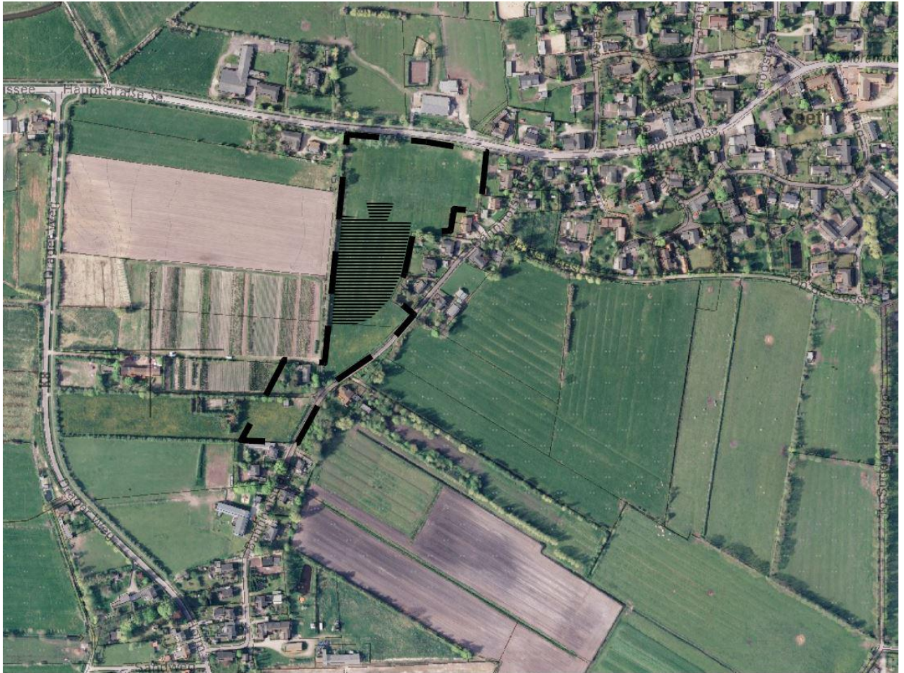
Abb. 2: Lage des Plangeltungsbereiches (schraffiert) innerhalb des Geltungsbereiches des B-Plan Nr. 3 und der geplanten Erweiterungen